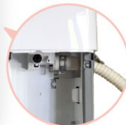
排水管連接方式 (此配件需另購)