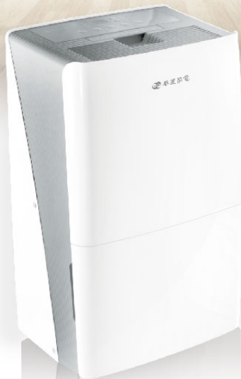
HPWS-30K / HPWS-40K / HPWS-50K